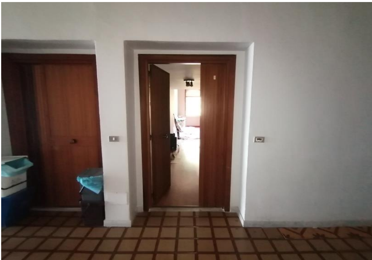
Foto n° 8 – Ingresso appartamento interessato da corridoio condominiale –