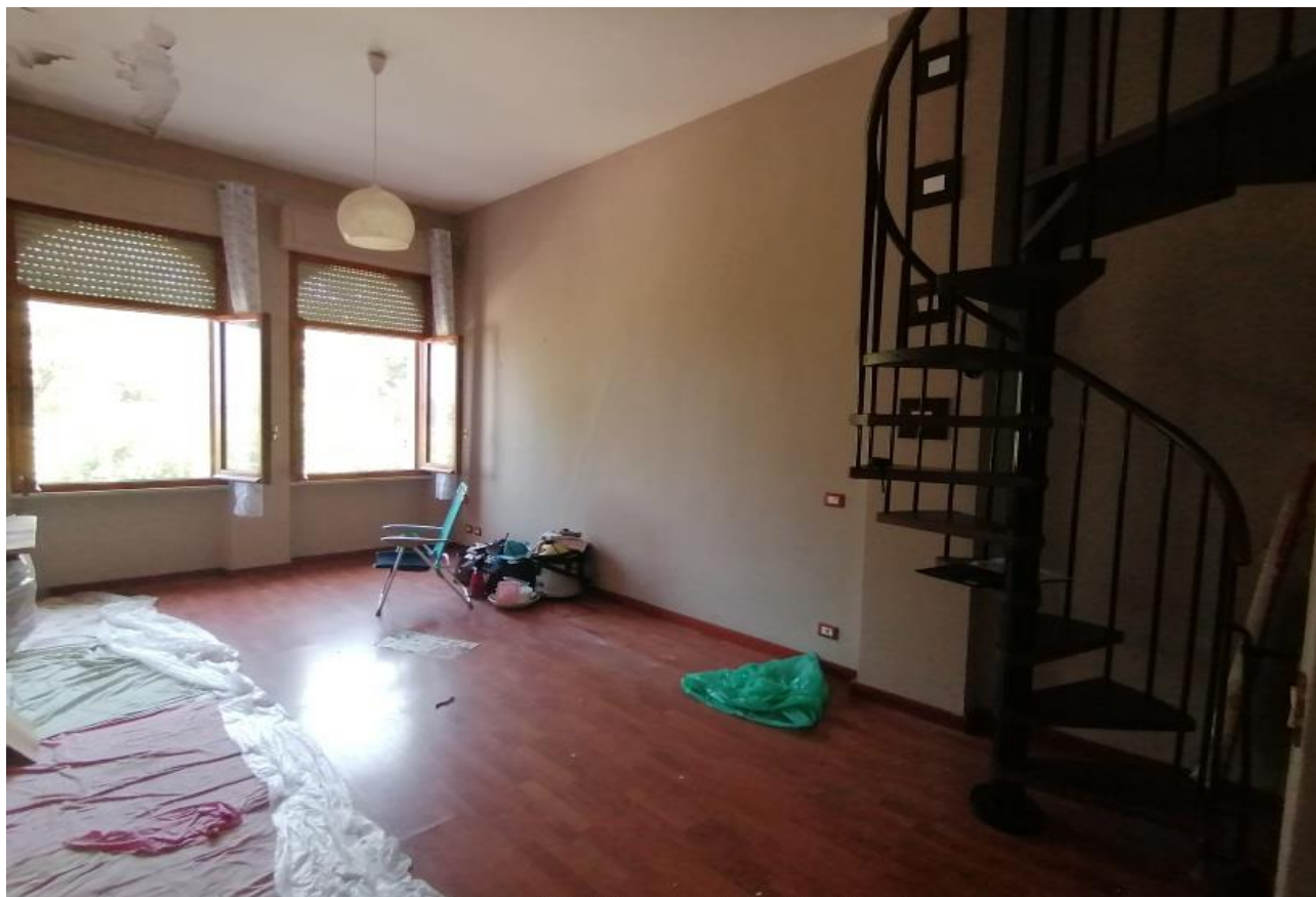
Foto n° 10 – Vano Soggiorno con vista parete esterna prospiciente a Nord –