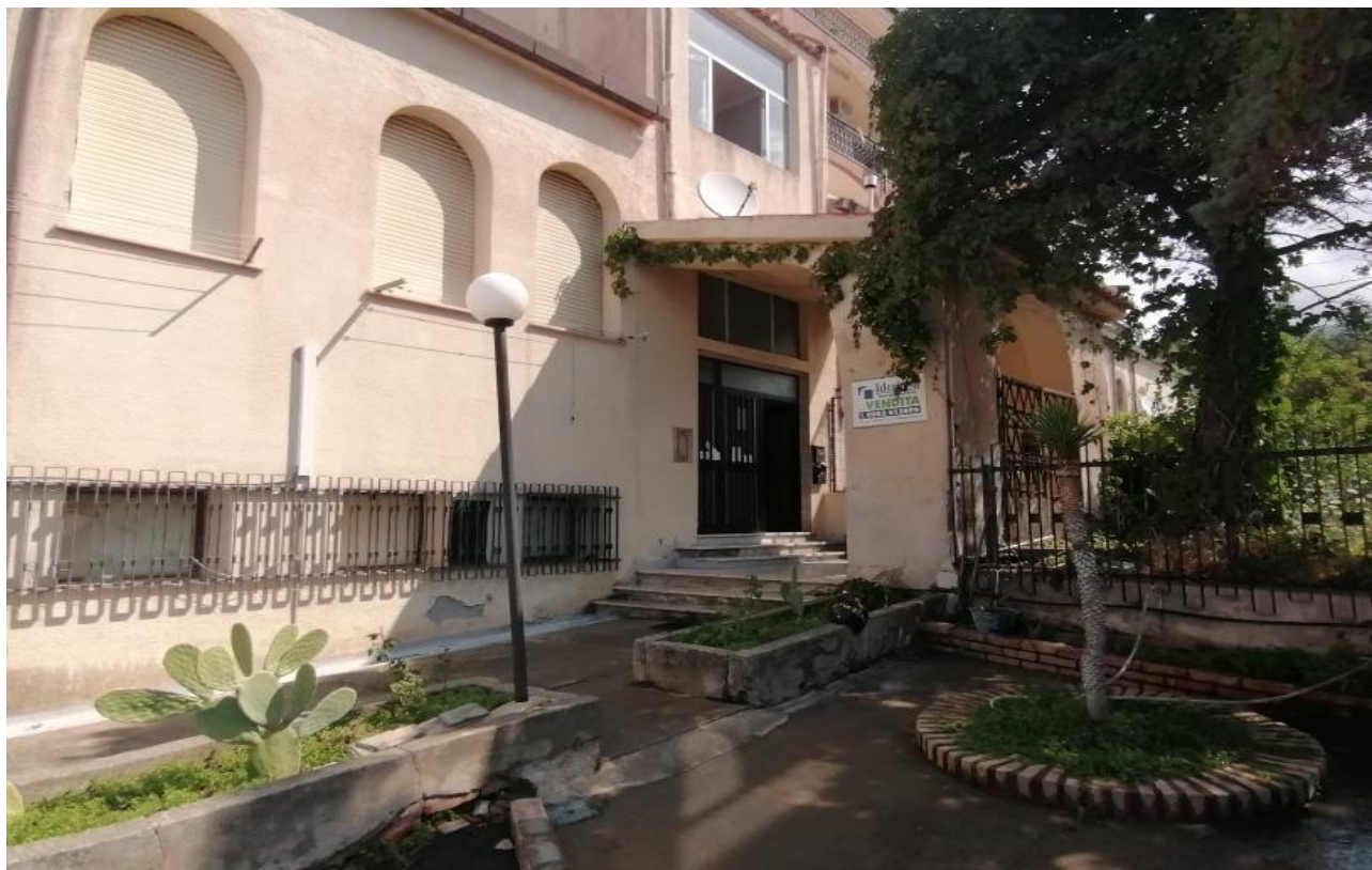
Foto n° 5 – Ingresso Condominio da corte comune, su prospetto Sud –